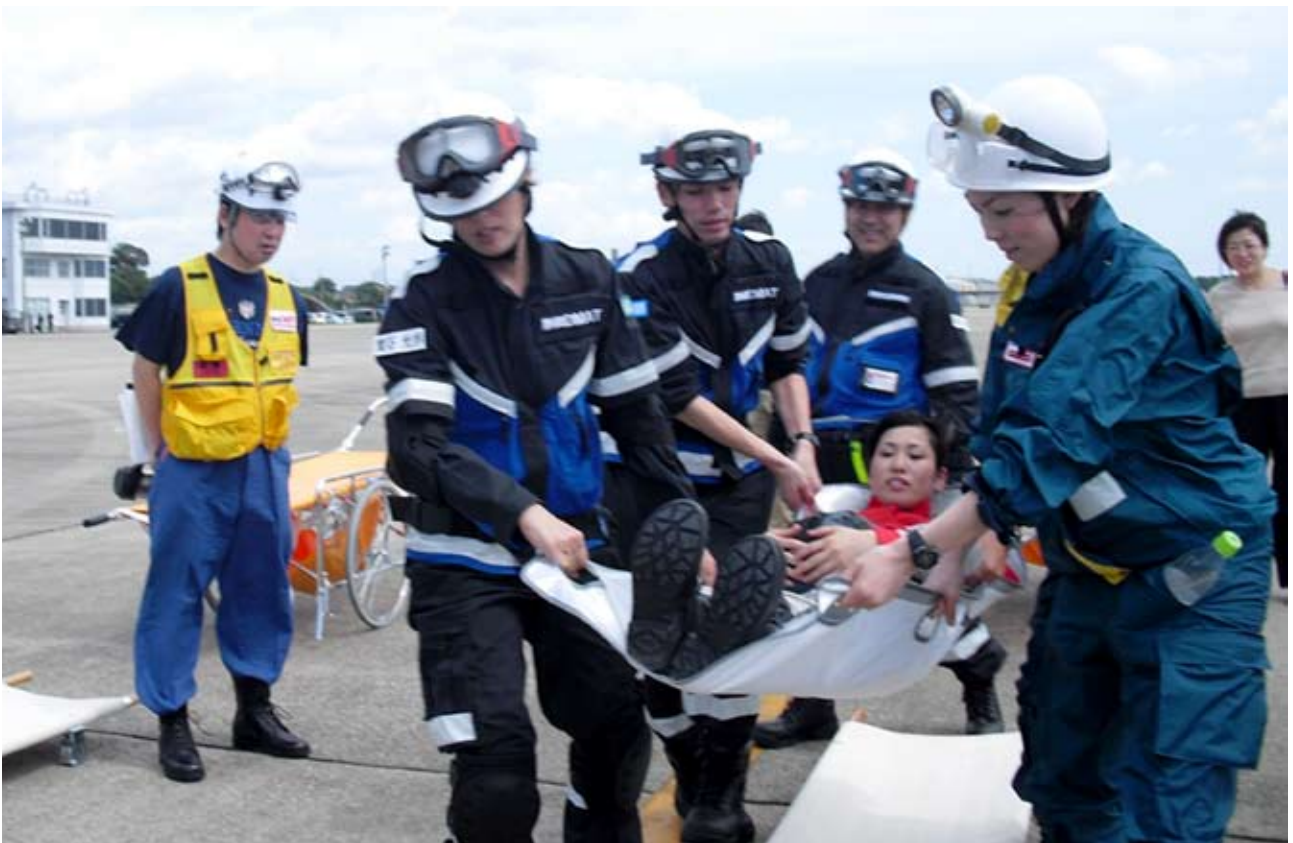
SCUの担架から、C-130輸送機用の担架に患者を移動。 C-130輸送機の担架の方が少し小さい。