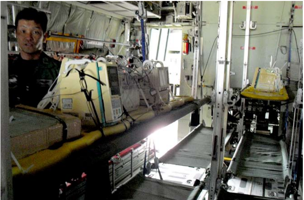
医療機器を搬入し固定。 医療機器の下の担架は、患者用スペース。