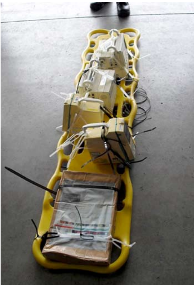
医療機器をバックボードへ結束バンドを 使用して固定