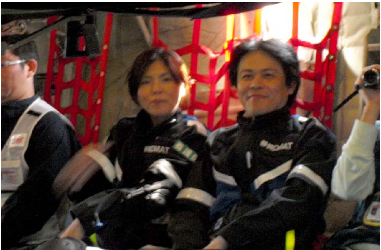
離陸及び着陸時を体験。（実際には、C-130輸送機は飛んでいませんが…） 騒音がすごかったです。