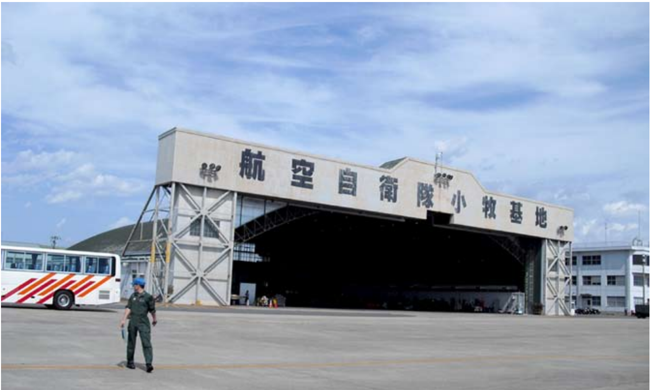
航空自衛隊小牧基地にて 患者搬送訓練を行う