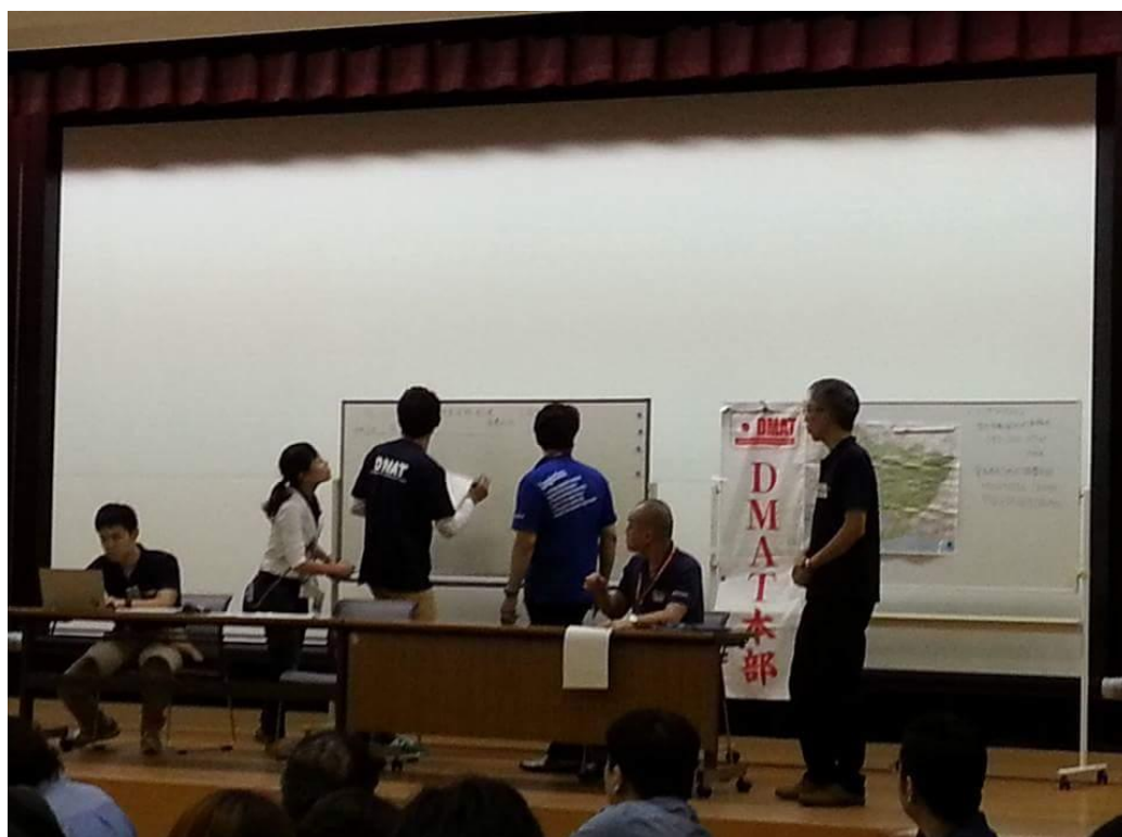
インストラクターによる、本部運営のデモ