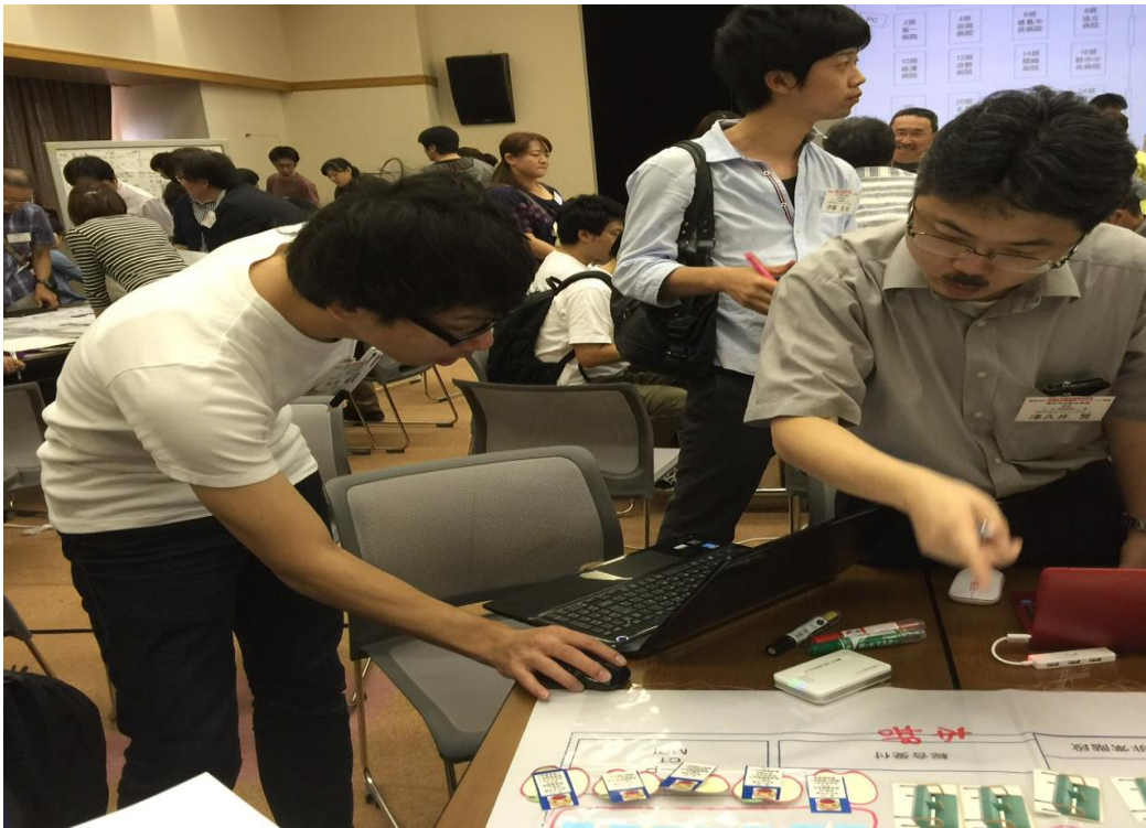
被災病院として、支援DMATの受入訓練