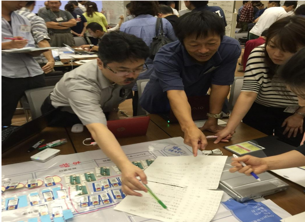
支援DMATと共に、被災患者の搬送順位付け