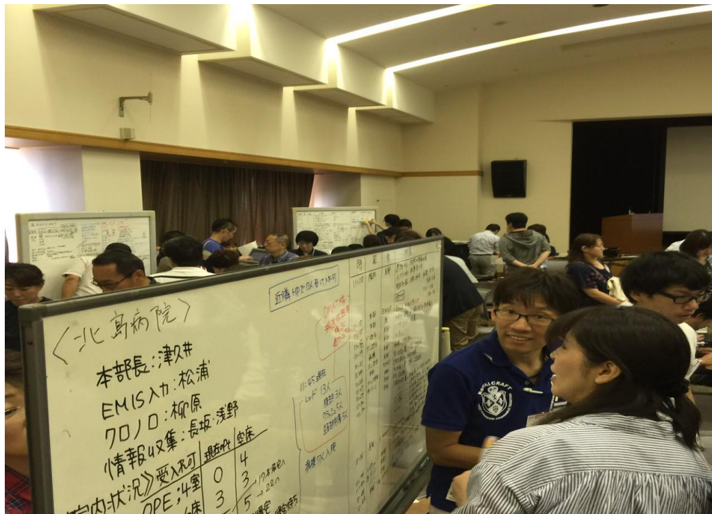
発災から記録を時系列に記載。大切な記録は、別に抜粋。