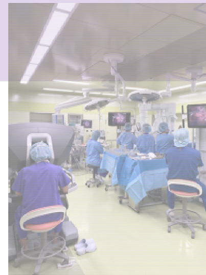
ダビンチ手術光景