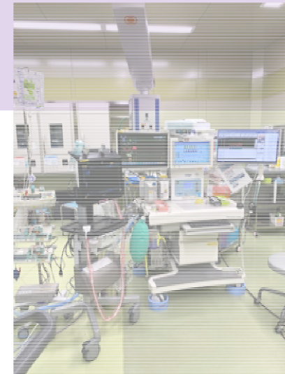
ダビンチ手術用 麻酔器システムと 汎用型超音波機器