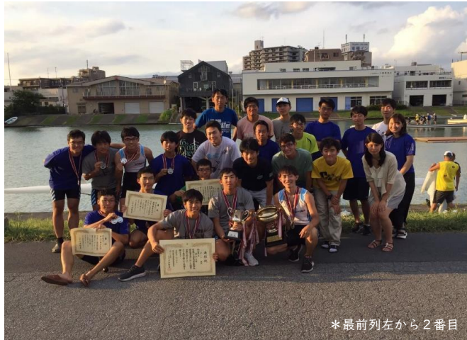
*最前列左から2番目

出身は東京都文京区で、出身高校は私立本郷高校、出身大学は東京大学です。大学時代は医学部ボート部に所属しておりました。マイナースポーツで競技人口が少ないのと、同期に恵まれたのもあって、3年生と4年生の東医体で優勝したのはちょっと自慢です。スポーツ全般が好きで、サイクリングやランニング、筋トレをやっているほか、4月からの一人暮らしで始めた料理も少し楽しくなってきました。いろんな話題で皆さんとお話してきたら嬉しいです。