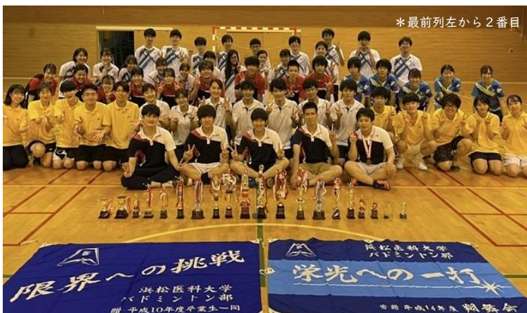
*最前列左から2番目

初期研修での目標は、まずは社会人としてのマナーを身につけたいと思っております。また、初期研修の2年間は医師としての土台となる大切な期間なので、何事にも積極的に参加し、自ら進んで学ぶ姿勢を身につけたいと思っております。1年後には頼り甲斐のある今の2年目の先輩方に少しでも近づけるように充実した1年にしたいと考えております。